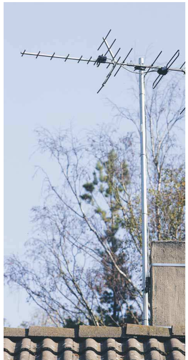
Problem med dålig tv-bild är störst på östra sidan från Böda och neråt. I vissa områden hjälper det inte ens att byta ut antenner och gamla kablar.